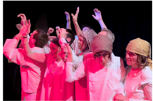
Un momento della messinscena di 'Unnötig'